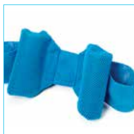
Appoggiatesta a contenimento laterale