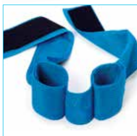
Cintura per abduzione